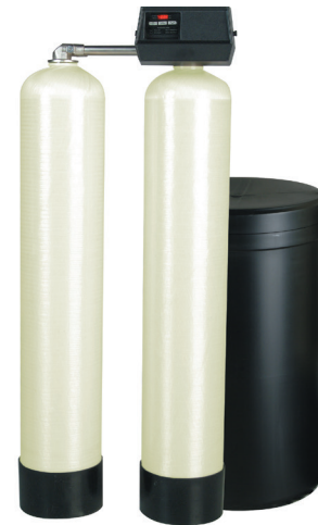
Série PWS10T Twin Alternating